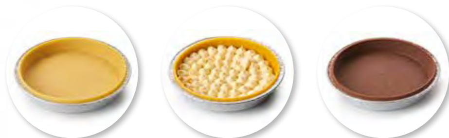
Bordalou Bodem Ø14 cm / Aluminium / Ongebakken / 91 g 8st. / tray Ref. 0572