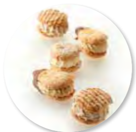
Biscuit Vanille ± 530 g 27st. / box Ref. 1076