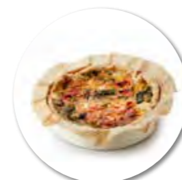
Hartige taart Méditerranée Ø16 cm / Houten ring / Gebakken / 480 g 6st. / tray Ref. FP0051