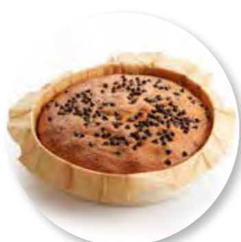
Cake Chocolade Straciattelli Ø16 cm / Houten ring / Gebakken / 405 g 6st. / tray Ref. 0282