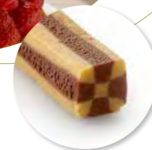
Deegstang Domino Zùsto Ongebakken 4500 g / tray Ref. 0920