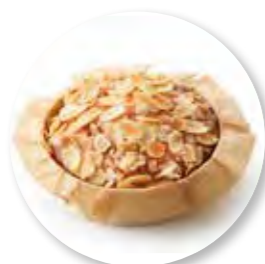
Cake Amandel Ø10 cm / Houten ring / Gebakken / 110 g 20st. / tray Ref. 0271