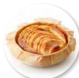
Cake Appel Ø10 cm / Houten ring / Gebakken / 115 g 20st. / tray Ref. 0273