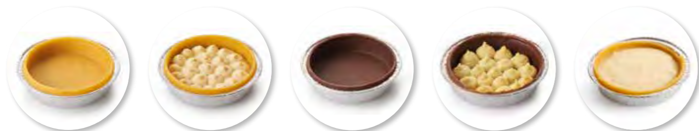
Bordalou Bodem Ø8 cm / Aluminium / Ongebakken / 33 g 24st. / tray Ref. 0542

Bordalou is een specialiteit uit Parijs; een luxe boterdeegbodem, gevuld met een smeùige vulling met extra veel amandelbroyage. De boterbodem is naar recept van Wittamer en de vulling naar recept van Debailleul, ode aan de twee patrons waar Dirk Peeters van Didess de bakkersstiel destijds geleerd heeft. De basis bodems zijn geschikt om naar eigen smaak te vullen, waardoor je je eigen identiteit kunt behouden.