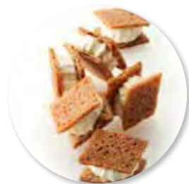
Tartine Russe ± 530 g 42st. / box Ref. 1077