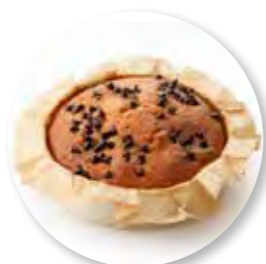
Cake Chocolade Straciattelli Ø10 cm / Houten ring / Gebakken / 110 g 20st. / tray Ref. 0272