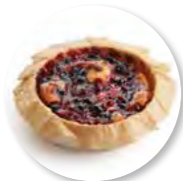
Cake Rood Fruit Ø10 cm / Houten ring / Gebakken / 115 g 20st. / tray Ref. 0275