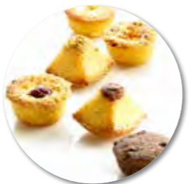
Assortiment Friands 750 g ±65st. / box Ref. 1207