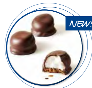
Mello Cakes Pure Chocolade 22 g per st. 20st. / box Ref. 1087