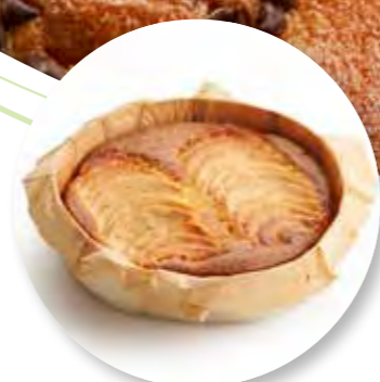
Cake Appel Ø16 cm / Houten ring / Gebakken / 430 g 6st. / tray Ref. 0283