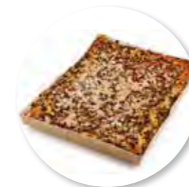
Amandel-Fruitcake Rabarber 385 x 280 x 32 mm / 2300 g 1st. / tray Ref. 0403 * -18°