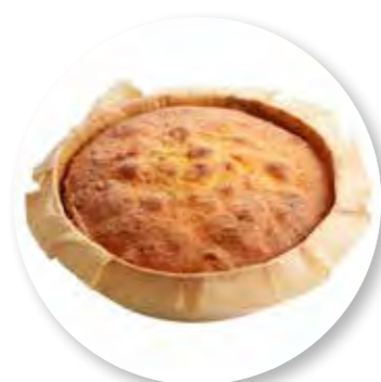
Cake Natuur Ø16 cm / Houten ring / Gebakken / 410 g 6st. / tray Ref. 0280