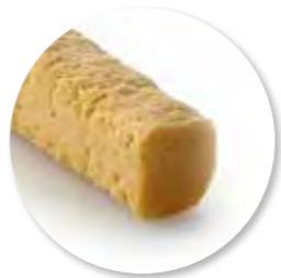
Deegstang Pain Turc Ongebakken 4500 g / tray Ref. 0664