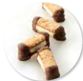
Bokkenpootjes ± 550 g 24st. / box Ref. 1075