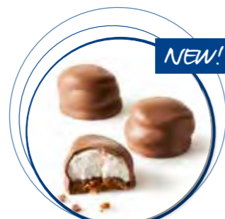
Mello Cakes Melkchocolade 22 g per st. 20st. / box Ref. 1086