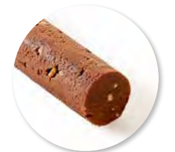
Deegstang Chocolade Hazelnoot Zùsto Ongebakken 4500 g / tray Ref. 0922