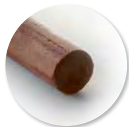
Deegstang Chocolade Ongebakken 4500 g / tray Ref. 0662