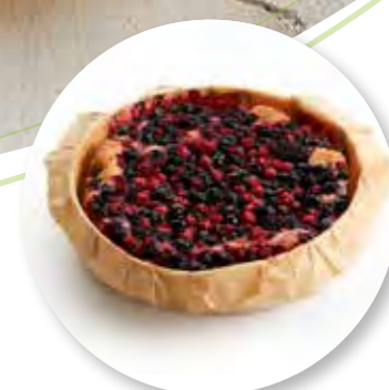
Cake Rood Fruit Ø16 cm / Houten ring / Gebakken / 520 g 6st. / tray Ref. 0285