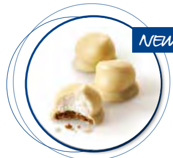
Mello Cakes Witte Chocolade 22 g per st. 20st. / box Ref. 1085