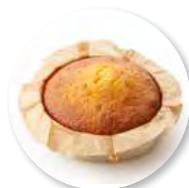
Cake Natuur Ø10 cm / Houten ring / Gebakken / 110 g 20st. / tray Ref. 0270