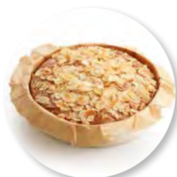
Cake Amandel Ø16 cm / Houten ring / Gebakken / 410 g 6st. / tray Ref. 0281