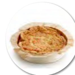
Hartige taart Lorraine Ø16 cm / Houten ring / Gebakken / 480 g 6st. / tray Ref. FP0050

De hartige taarten van Didess for Bakeries worden gemaakt in een artisanale houten ring die handmatig wordt gevuld met verse kwaliteitsingrediënten. De bodem is gemaakt van heerlijk knapperig bladerdeeg en de hartige taart wordt gevuld met een quiche pap op basis van volle room 40% en scharreleieren.