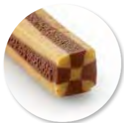
Deegstang Domino Ongebakken 4500 g / tray Ref. 0663