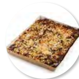
Amandel-Fruitcake Peer Chocolade 385 x 280 x 32 mm / 2300 g 1st. / tray Ref. 0401 * -18°