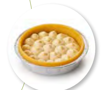
Bordalou Basis Zùsto Ø8 cm / Aluminium / Ongebakken / 60 g 24st. / tray Ref. 0941