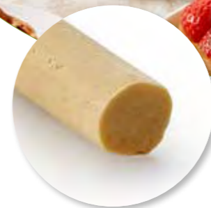
Deegstang Vanille Amandel Zùsto Ongebakken 4500 g / tray Ref. 0921