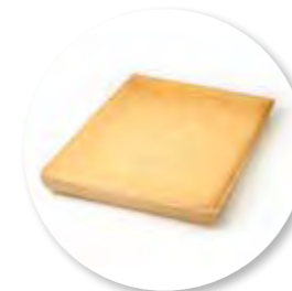
Biscuit Natuur 385 x 280 x 32 mm / 700 g 1st. / tray Ref. 0001 * -18°