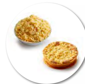
Bordalou Appel Crumble Ø 8 cm / Aluminium / Ongebakken / 115 g 24st. / tray Ref. 0535 * -18°