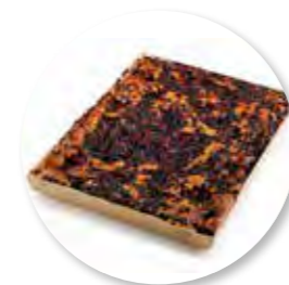
Amandel-Fruitcake Rood Fruit 385 x 280 x 32 mm / 2300 g 1st. / tray Ref. 0404 * -18°