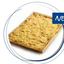
Amandel-Fruitcake Appel Crumble 385 x 280 x 32 mm / 2300 g 1st. / tray Ref. 0405 * -18°