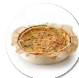
Hartige taart Zalm Ricotta Ø16 cm / Houten ring / Gebakken / 480 g 6st. / tray Ref. FP0052