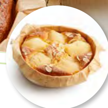
Cake Peer Amandel Ø16 cm / Houten ring / Gebakken / 510 g 6st. / tray Ref. 0284