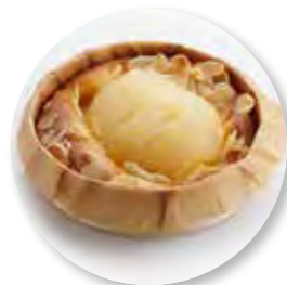
Cake Peer Amandel Ø10 cm / Houten ring / Gebakken / 120 g 20st. / tray Ref. 0274