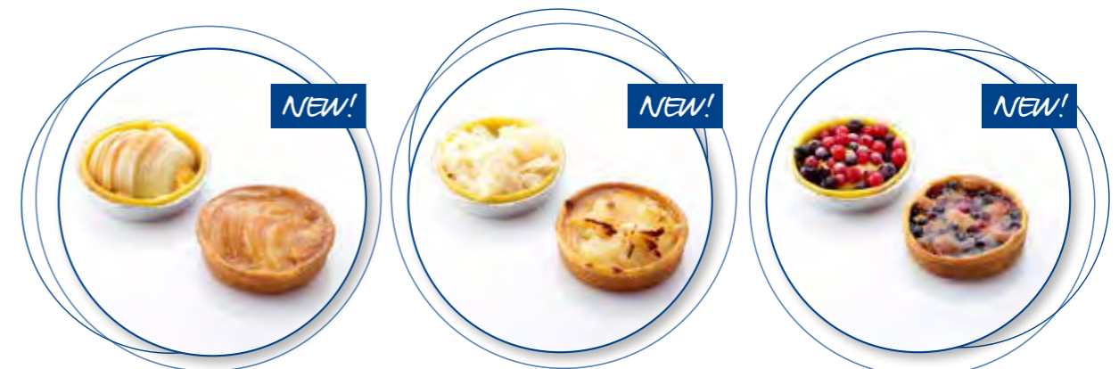
Bordalou Appel 8 Ø cm / Aluminium / Ongebakken / 115 g 24st. / tray Ref. 05222 * -18°