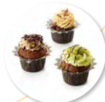
Cupcake Chocolate Collection ± 45 g per st. 12st. / box Ref. 03003