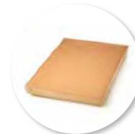
Biscuit Chocolade 385 x 280 x 32 mm / 700 g 1st. / tray Ref. 0000 * -18°