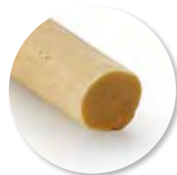
Deegstang Vanille Ongebakken 4500 g / tray Ref. 0661

De specialiteit van Didess zijn koekjes. Speciaal voor Didess for Bakeries leveren we verschillende deegstangen om u de vrijheid te geven uw koekjes naar eigen creativiteit af te werken. Elke dag een vers gebakken koekje in de winkel. Heerlijk!