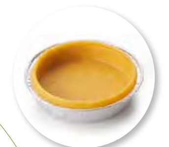
Bordalou Bodem Zùsto Ø8 cm / Aluminium / Ongebakken / 33 g 24st. / tray Ref. 0940