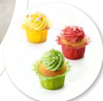
Cupcake Fruit Collection ± 45 g per st. 12st. / box Ref. 03000

De koekjes en cakes van Didess worden zeer vakkundig en met passie gemaakt. Ze zijn een ware verwennerij op feestelijke momenten. Door de korte ontdooitijd zijn ze snel en makkelijk in gebruik. Breng op een eenvoudige manier meer luxe en variatie in uw aanbod.